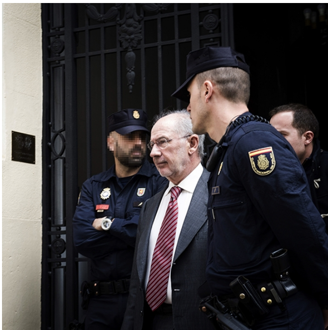
El exvicepresidente Rodrigo Rato