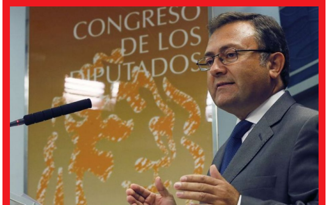
El secretario general del Grupo Parlamentario Socialista Miguel Ángel Heredia

El Grupo Parlamentario Socialista ha pedido al Ministerio de Educación, Cultura y Deporte que corrija la interpretación que hace del decreto que regula la concesión de becas y que ha llevado a un número importante de estudiantes de Formación Profesional a ver recortada considerablemente la cuantía de su beca por tener asignaturas convalidadas al cambiar de ciclo. "No puede ser que el Gobierno siempre haga una lectura restrictiva