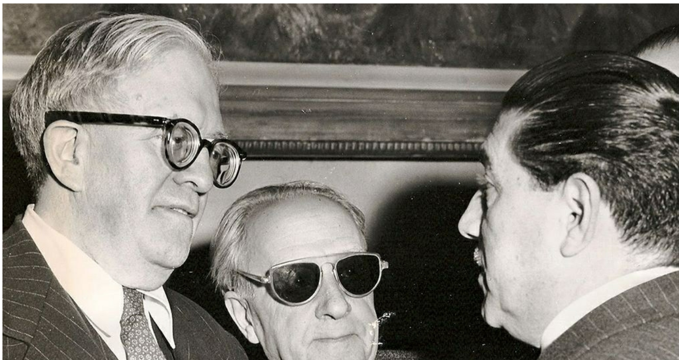
J. Álvarez del Vayo (i) en Naciones Unidas (New York, 16-05-1949)